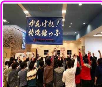
年末年始の中3恒例「絶対合格感動合宿」の年内締めくくりの1シーン。今回も大いに盛り上がりました!

新年を迎えました、1年の計は元旦にありといいますが、みなさんは今年の目標を立てましたか。目標といとなにか壮大なものにとらえる人がいますが、そんなことはありません。小さなことでもかまわないです。大切なのは、昨年を振り返り、次の1年間の見通しを立てることです。私たちは経験から学ぶことしかできません。教科書だって誰かの経験から作られています。みなさんが過ごしてきた日々はすべて貴重な経験です。それを振り返っているときに、もっとこうすればよかったとか、こうなっていたらよかったのとか、いろいろと出てくるでしょう。そのうちのひとつを目標にすればよいのです。きっと日常の解像度が上がります。〔金子祐太〕