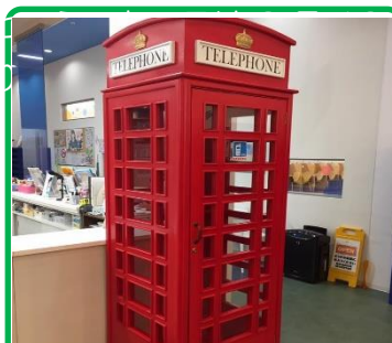
真っ赤な家庭への携帯通話用 テレホンブース新設しました。

スーパー『MANDAI』オープンにより、土日祝は駐車場混雑が予想されます。お車での縦時には、「送迎証」を必ず車内フロントに提示ください。